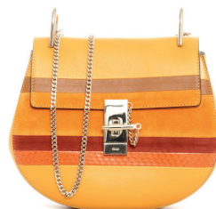
CHLOÉ CHEZ STUDIO 14 18 500 DH.