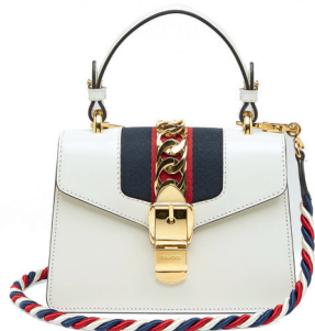
GUCCI 21 950 DH.