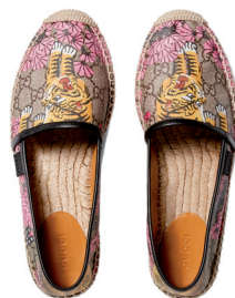
GUCCI 3 800 DH.