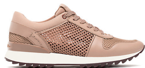
MASSIMO DUTTI 850 DH.