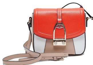
LA MARTINA 2 950 DH.