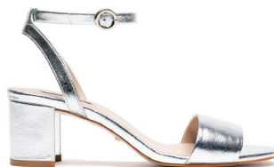
MASSIMO DUTTI 995 DH.