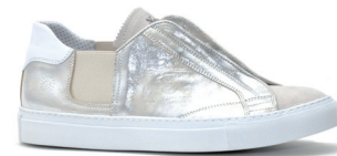
LA MARTINA 2 900 DH.