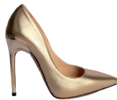
PADOVAN CHEZ LA STRADA 4 990 DH.