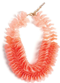
UTERQÜE 995 DH.