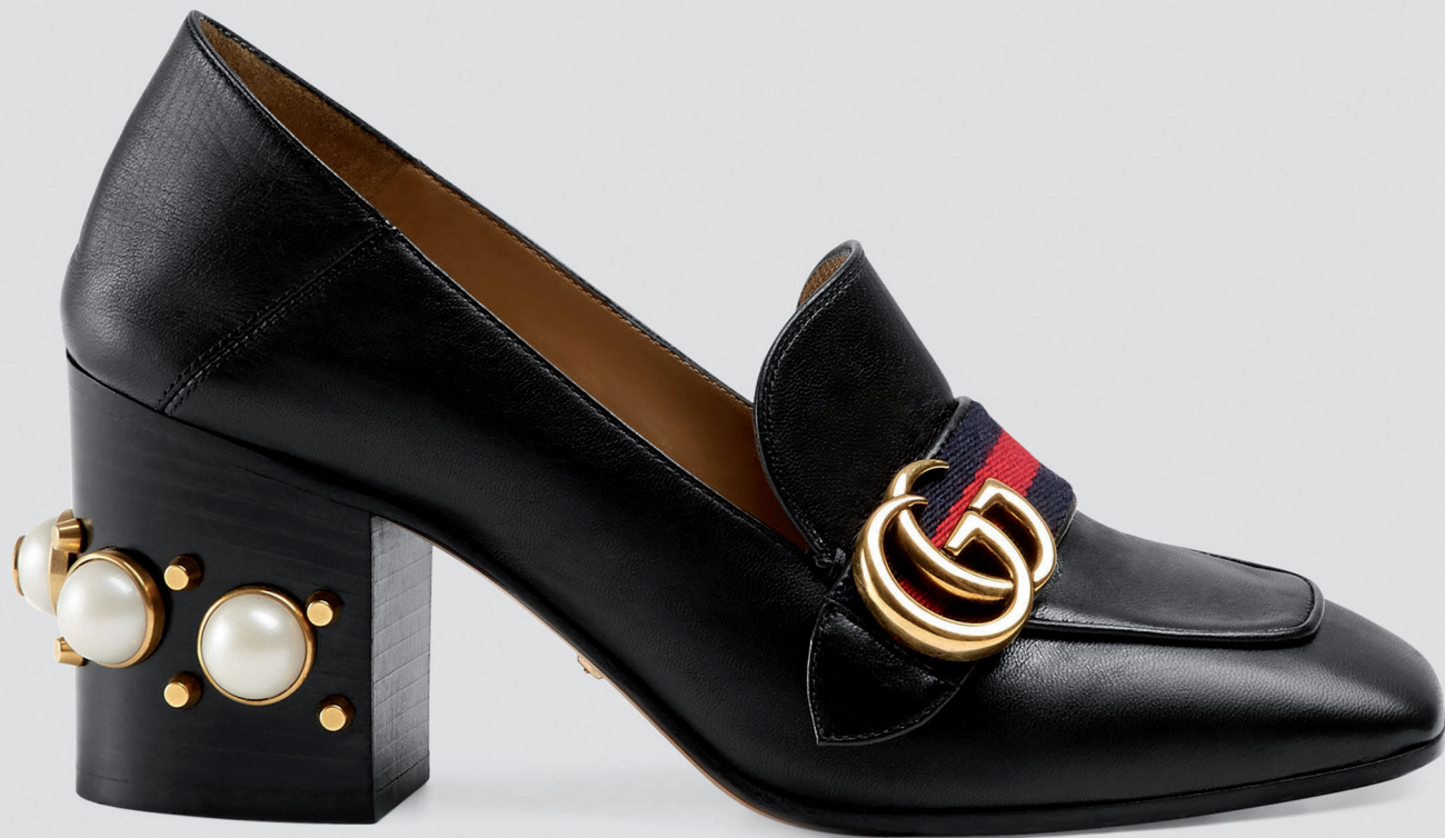
GUCCI 10950 DH.