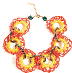
UTERQÜE 795 DH.