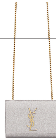
SAINT LAURENT 15 610 DH.