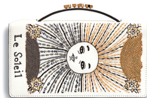
DIOR 29 500 DH.