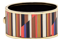
MASSIMO DUTTI 395 DH.