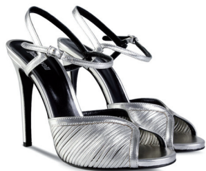
JUST CAVALLI 4 150 DH.