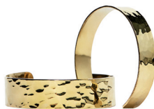
MASSIMO DUTTI 295 DH.