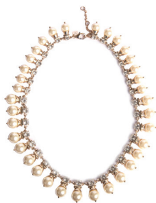
BANANA REPUBLIC 695 DH.