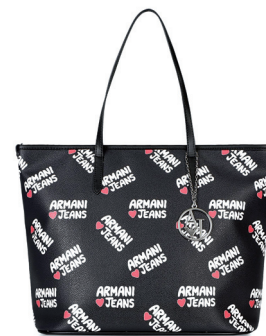
ARMANI JEANS 2 100 DH.