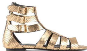
JUST CAVALLI 5 350 DH.