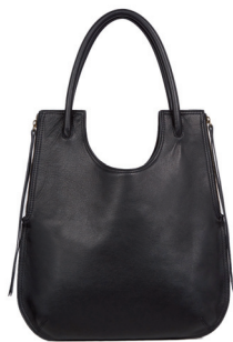
GERARD DAREL 3 600 DH.