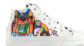
JUST CAVALLI 3 900 DH.