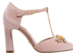
UTERQÛE 1 495 DH.