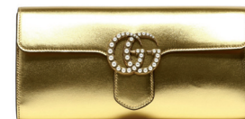
GUCCI 13 500 DH.