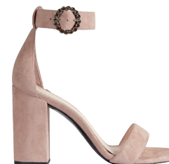
MAJE 3 550 DH.