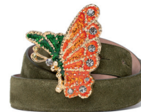
UTERQÜE 795 DH.