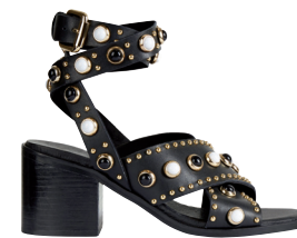
MAJE 5 040 DH.