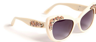
UTERQÛE 1 495 DH.