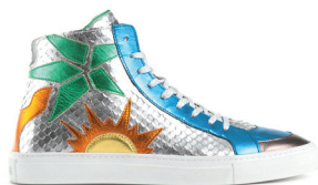
JUST CAVALLI 4 950 DH.