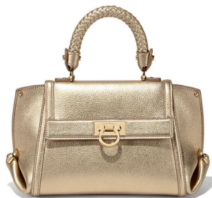
SALVATORE FERRAGAMO CHEZ BELLA PELLE 19 950 DH.