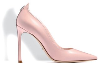
DIOR 9 100 DH.