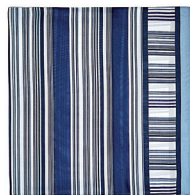
MASSIMO DUTTI 595 DH.