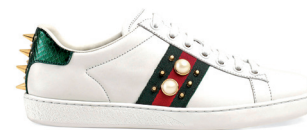
GUCCI 6 550 DH.