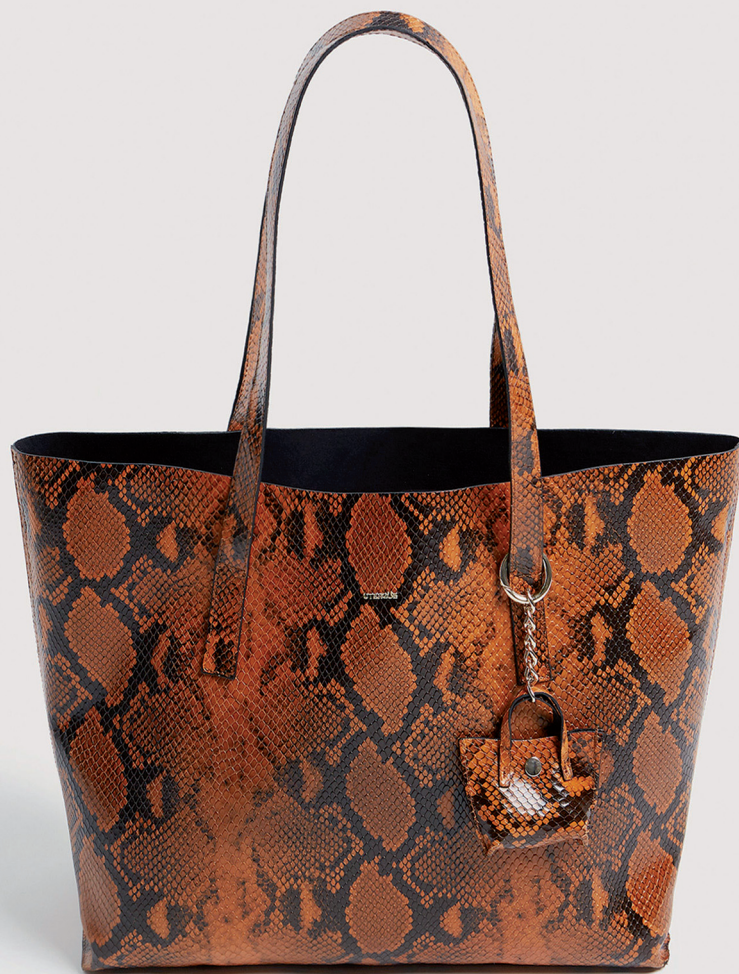
UTERQÜE 2 295 DH.