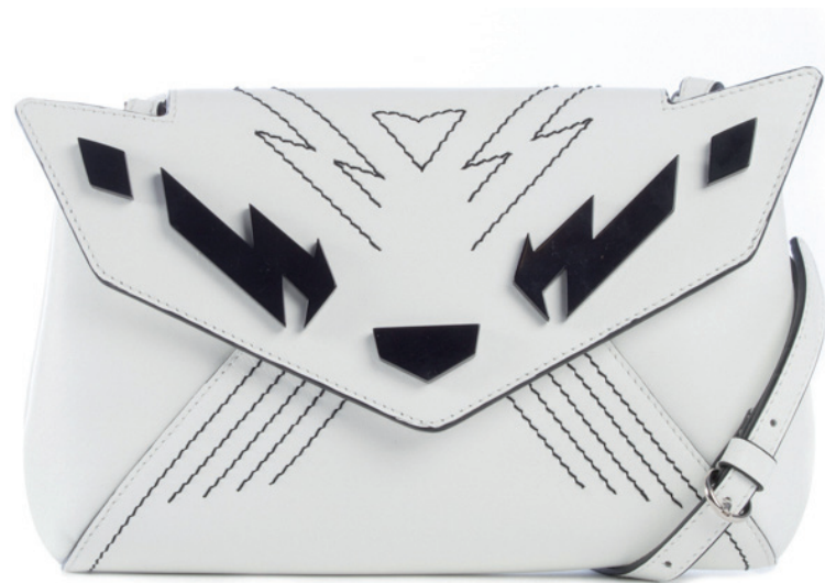
JUST CAVALLI 4 450 DH.