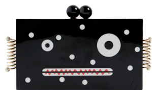
UTERQÜE 1 495 DH.