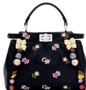
FENDI 42 900 DH.