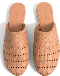
UTERQÛE 995 DH.