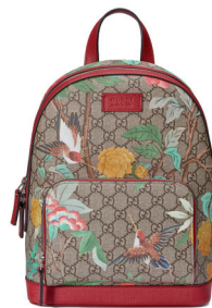
GUCCI 12 050 DH.