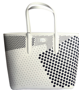
LACOSTE 3 295 DH.