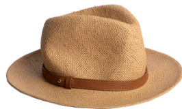
BANANA REPUBLIC 595 DH.