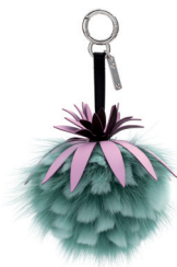
FENDI 6 650 DH.