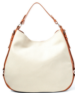
POLO RALPH LAUREN 4 500 DH.