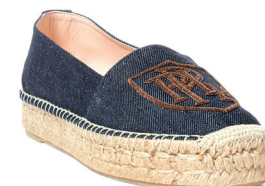
POLO RALPH LAUREN 2 150 DH.