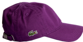
LACOSTE 395 DH.