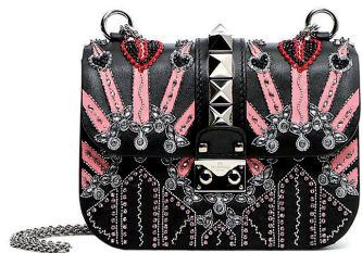
VALENTINO CHEZ STUDIO 14 36 770 DH.