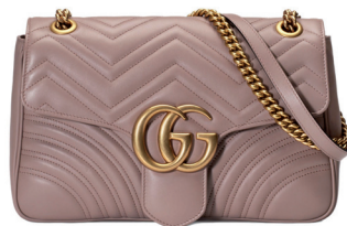
GUCCI 21 950 DH.