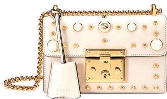
GUCCI 22 700 DH.