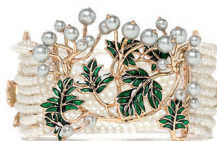
UTERQÜE 695 DH.