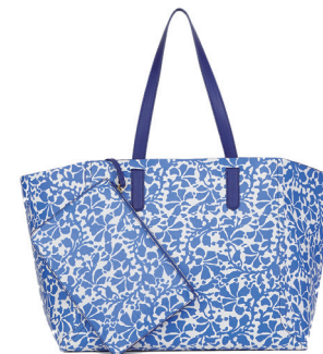
GERARD DAREL 2 200 DH.