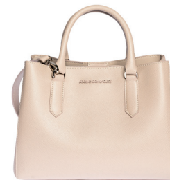
ADOLFO DOMINGUEZ 1 760 DH.