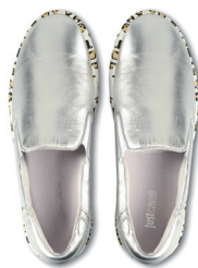
JUST CAVALLI 4 300 DH.