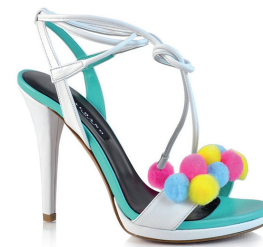
ALBANO CHEZ LA STRADA 3 190 DH.