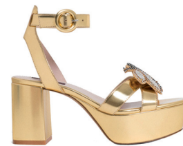
UTERQUË 1 495 DH.