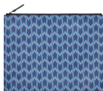
MAJE 1 280 DH.