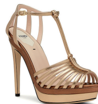
FENDI 10 700 DH.