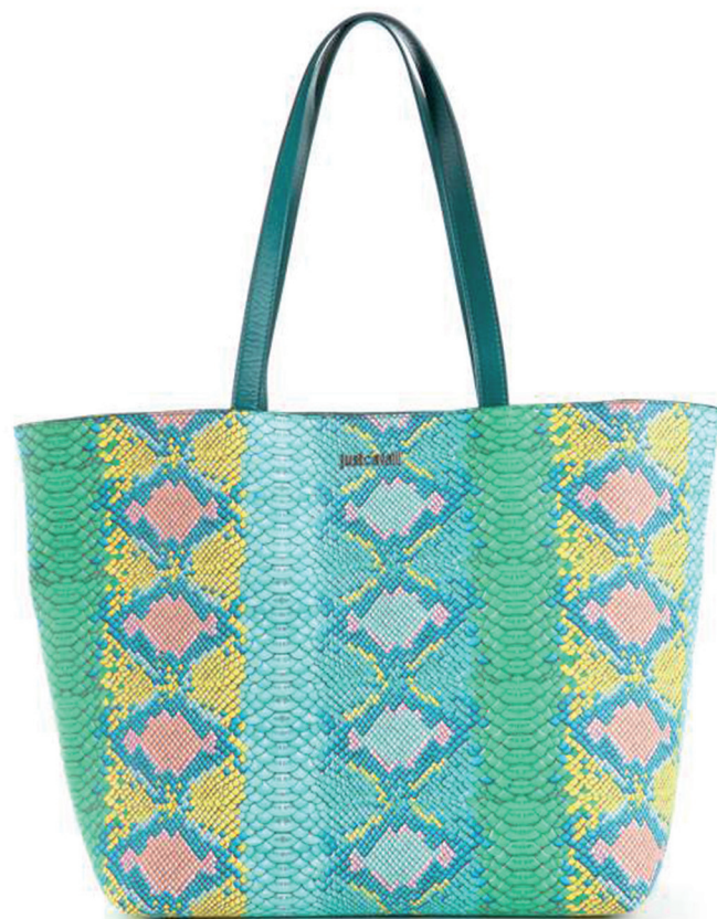
JUST CAVALLI 3 350 DH.