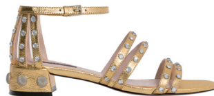
UTERQÜE 1 295 DH.