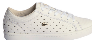
LACOSTE 1 445 DH.