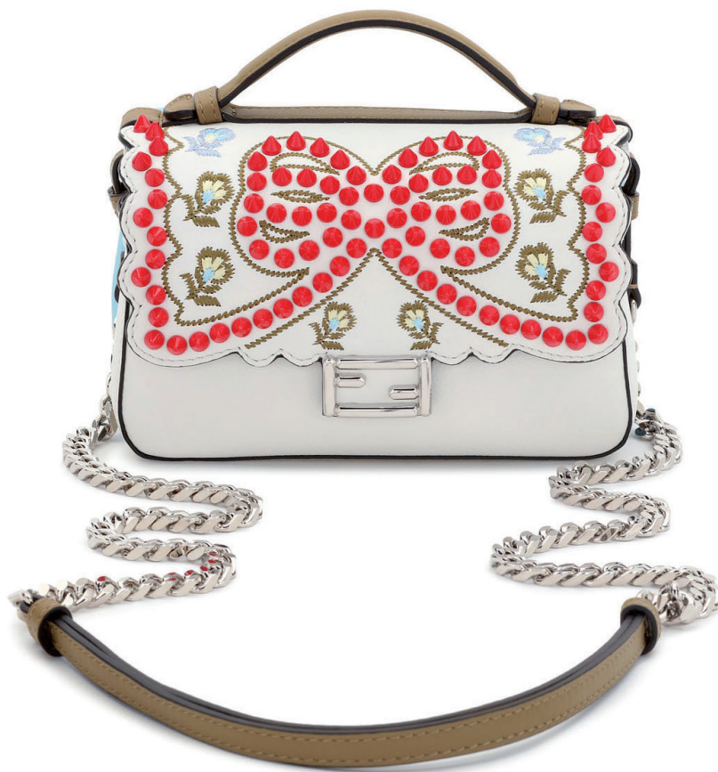
FENDI 19 800 DH.