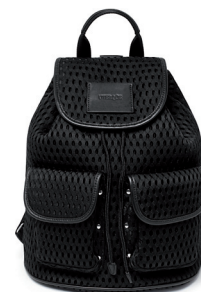
UTERQÜE 1 195 DH.