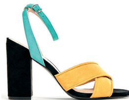
MASSIMO DUTTI 1 995 DH.