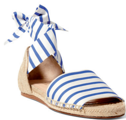
POLO RALPH LAUREN 2 050 DH.