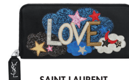
SAINT LAURENT 7 170 DH.