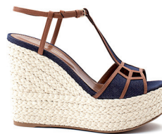
SERGIO ROSSI CHEZ BELLA PELLE 8 590 DH.