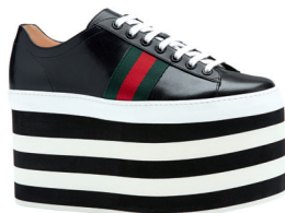
GUCCI 9 700 DH.