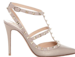
VALENTINO CHEZ STUDIO 14 9 380 DH.