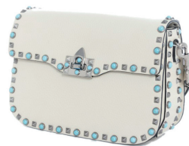
VALENTINO CHEZ STUDIO 14 32 350 DH.