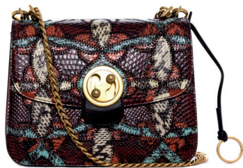
CHLOÉ CHEZ STUDIO 14 37 630 DH.