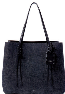
POLO RALPH LAUREN 3 500 DH.