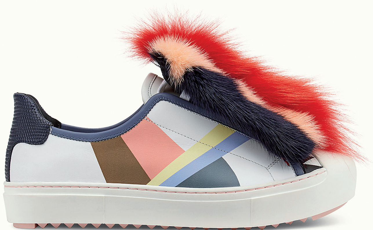
FENDI 11 000 DH.